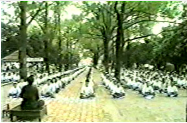
Một lớp Thiền tịnh ( Quán không).