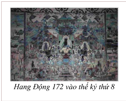
Hang Động 172 vào thế kỷ thứ 8

Tín ngưỡng nổi bật của Đại Thừa là về Tịnh độ và Bồ Tát. Phật Tử Đại Thừa thường thờ Phật A-Di-Đà (Amitābha) và Bồ Tát (Bodhisattvas). Đức Phật A-Di-Đà được giới thiệu vào Trung Hoa khoảng thế kỷ thứ II. Trường phái Tịnh độ là thành công nhất ở Trung Quốc. Đa số Phật Tử Đại Thừa thực hành Tịnh độ. Các bức tranh ở Đôn Hoàng đề cập đến Phật A-Di-Đà và các nghi lễ thực hành. Trong hang động 172, bức tranh vào giữa thế kỷ thứ tám cho thấy Đức Phật A-Di-Đà là bậc thầy của Tây Phương Tịnh Độ, ngồi ở giữa hai vị Bồ