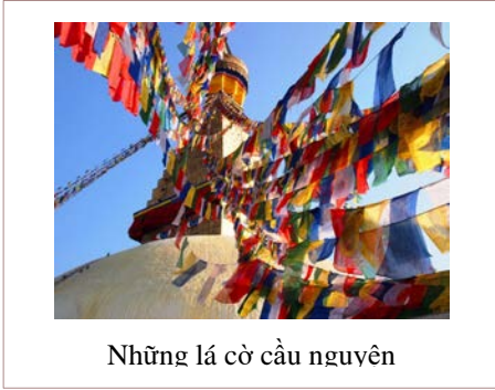
Những lá cờ cầu nguyện

lạy Phật, nhưng những ngày rằm và mồng một được cho là quan trọng. Người Tây Tạng cầu nguyện bằng cách tụng kinh “Aum mane padme hum” (Án Ma-Ni Bát Di Hồng). Ngoài ra còn có bánh xe cầu nguyện và những lá cờ cầu nguyện. Những người theo đạo Phật Tây Tạng tin rằng những lời cầu nguyện là một cách xây dựng công đức, đó là phần thưởng cho những việc làm tốt đẹp.