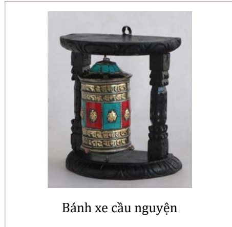
Bánh xe cầu nguyện

lạy Phật, nhưng những ngày rằm và mồng một được cho là quan trọng. Người Tây Tạng cầu nguyện bằng cách tụng kinh “Aum mane padme hum” (Án Ma-Ni Bát Di Hồng). Ngoài ra còn có bánh xe cầu nguyện và những lá cờ cầu nguyện. Những người theo đạo Phật Tây Tạng tin rằng những lời cầu nguyện là một cách xây dựng công đức, đó là phần thưởng cho những việc làm tốt đẹp.