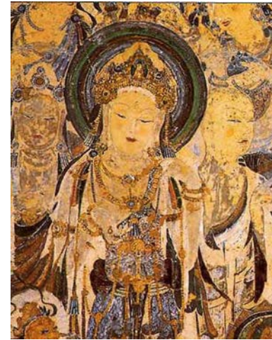
Guanyin: Mogao Caves, #57,